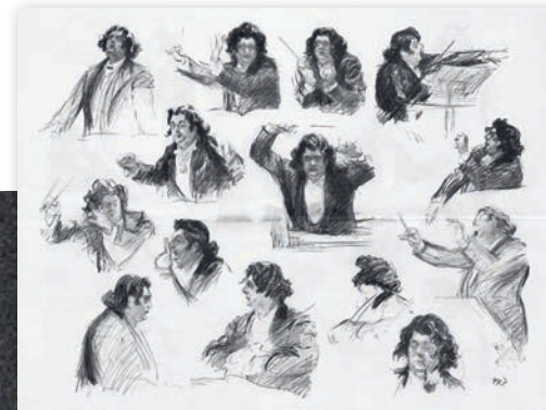
Eugène Ysaÿe chef d'orchestre par Paul Renouard, Bibliothèque royale de Belgique, Mus. 2014 C 1.