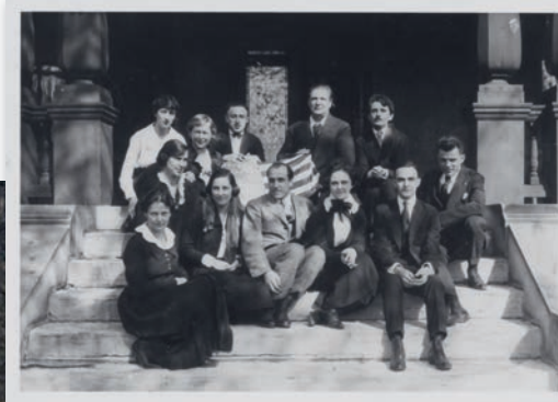
Eugène Ysaÿe devant l'entrée du Cincinatti Conservatory of Music avec ses élèves, 1921. Bibliothèque royale de Belgique, Mus. Ms. 161/81.

Crise de couple et première tournée américaine, 1894 Succès américains, violons et nouvelle tournée russe, 1895 Concerts Ysaÿe, duo avec Pugno et Poème de Chausson, 1896 Secondes tournées italienne et américaine, 1897 Démission du Conservatoire de Bruxelles et retour au pays, 1898 Mort de Chausson, 1899 Quatuor Ysaÿe reconstitué et nouvelles compositions, 1900 Succès anglais et Rachmaninov, 1901 Remise en question et fin du Quatuor Ysaÿe, 1902