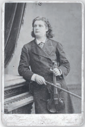
Eugène Ysaÿe à Kiev, 1883. Bibliothèque royale de Belgique, Mus. Ms. 161/135.