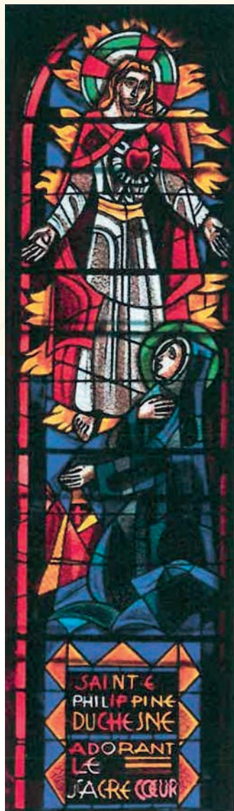
Vitrail de sainte Philippine Duchesne, église de Grâne.

(À sa nièce, Mère Amélie Jouve, 10 octobre 1847)